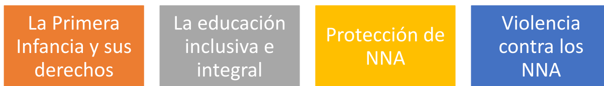
Figura 4. Áreas de atención y salvaguarda de los derechos de los NNA (Elaboración propia)

Para la presentación de estos hallazgos se han delimitado, las áreas siguientes: