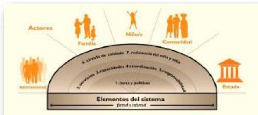
Figura 1. Siete elementos y cinco tipos de actores principales del Sistema de Protección Infantil