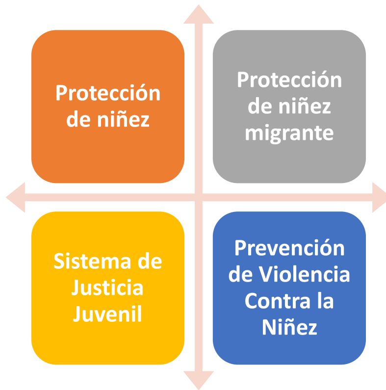
Figura 5. Ámbitos de actuación para salvaguardar los derechos de los NNA en el marco del SIGADENAH (Elaboración propia)

SIGADENAH el 9 abril, con la participación de varios ministros, viceministros y máximas autoridades de todas las instituciones públicas con mandatos relacionados con la niñez, para identificar estrategias efectivas y de esa forma brindar una atención integral y diferenciada a niños, niñas y adolescentes NNA en el marco de la pandemia. El CNNA identificó las siguientes prioridades: