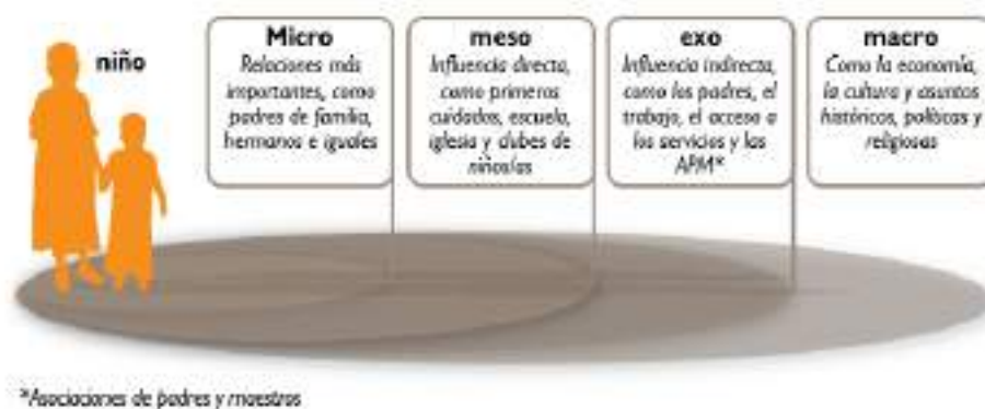
Figura 2. La Ecología del niño y la niña

Los elementos múltiples de un sistema de protección infantil funcionan en diferentes niveles de la ecología del niño y niña, desde el nivel micro al macro. Visión Mundial representa esta ecología del niño y niña en el siguiente diagrama: 1